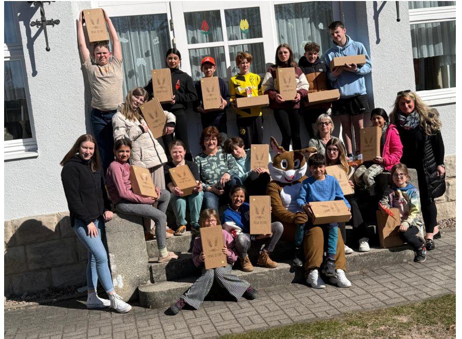
Kindervilla Wernshausen, Fotocredit: WerraEnergie