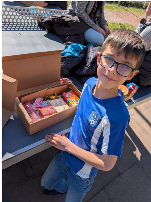
AWO Kinderhaus Schweina, Fotocredit: WerraEnergie